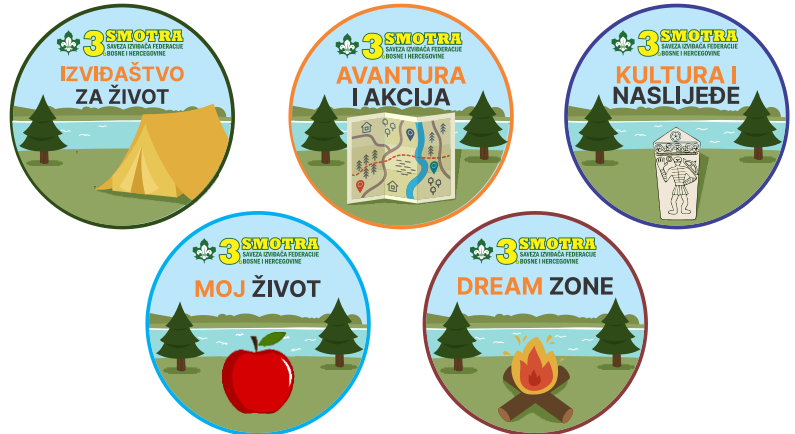
AMBLEMI PROGRAMSKIH AKTIVNOSTI